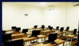
Laboratorium Komputer Full AC & Internet