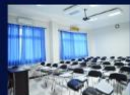
Ruang Kuliah Full AC, LCD, & Laptop