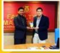
Kerjasama Luar Negeri